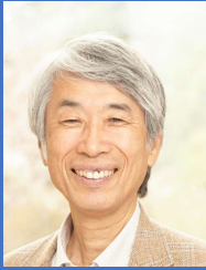
三瀬正道先生 (麗澤大学名誉教授)