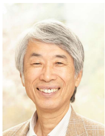
三瀨正道氏 (麗澤大学名誉教授)

※「中国語講座（入門者向け）」の受講は選択（希望）制です。 別途、各自のレベル・ニーズ・スケジュールに合わせた「プライベートレッスン」のご用意もあります。 (担当にお問合せください)